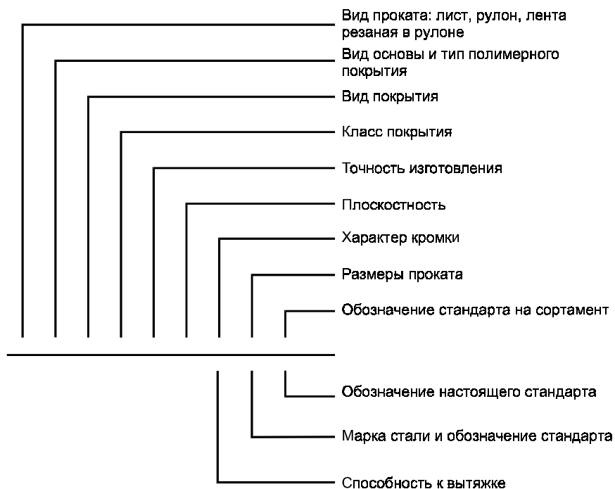
Схема условных обозначений проката с полимерным покрытием

П р и м е ч а н и е — При отсутствии какого-либо из параметров его выбирает предприятие-изготовитель.